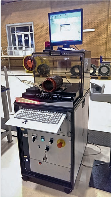
Тестер МТС3-6кВ с защитным кожухом