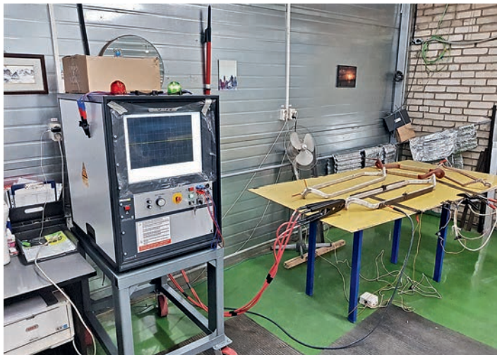
3 Тестер МТС2-40кВ и шаблонная катушка

Это касается и формируемых программой отчетов. И, что немаловажно, в него могут быть включены данные и логотип компании, выполняющей тестирование (рис 4).