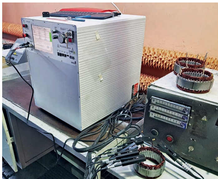
5 МТС2-6кВ с опцией тестирования прочности изоляции

Подписывая дистрибьюторский договор, компания принимает на себя определенные обязательства за производителя на вверенной ей территории. Выбор поставщика оборудования – непростая задача. В первую очередь, это осознанный разносторонний анализ имеющихся поставщиков оборудования. Немецкая компания Schleich, эксклюзивным дистрибьютором которой является Остек-Электро, не первый год показывает отличные результаты. Она уже четыре раза была награждена престижным титулом «ТОП-100 инновационных компаний Германии»: в 2012, 2014, 2016 и 2018 годах. Сегодня компания занимает лидирующие позиции по объемам продаж импульсных тестеров на территории Европы и США.