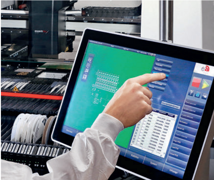
Essemtec Fox: настройка дозирования материалов и установки компонентов осуществляется при помощи единого программного обеспечения