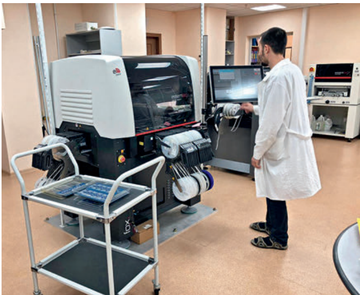
Essemtec Fox: работа сборочного центра не прекращается ни на минуту

Я бы не сказал, что это были сложности. Скорее, это были вопросы изменения сознания операторов – они привыкли работать с оборудованием предыдущего поколения, а у новых автоматов полностью сменилось программное обеспечение и сама концепция написания управляющих программ, работы с оборудованием. В этом смысле операторам нужно было перестроиться. И нельзя забывать о том, что мы не убрали старое оборудование из эксплуатации, оно также у нас эффективно эксплуатируется.