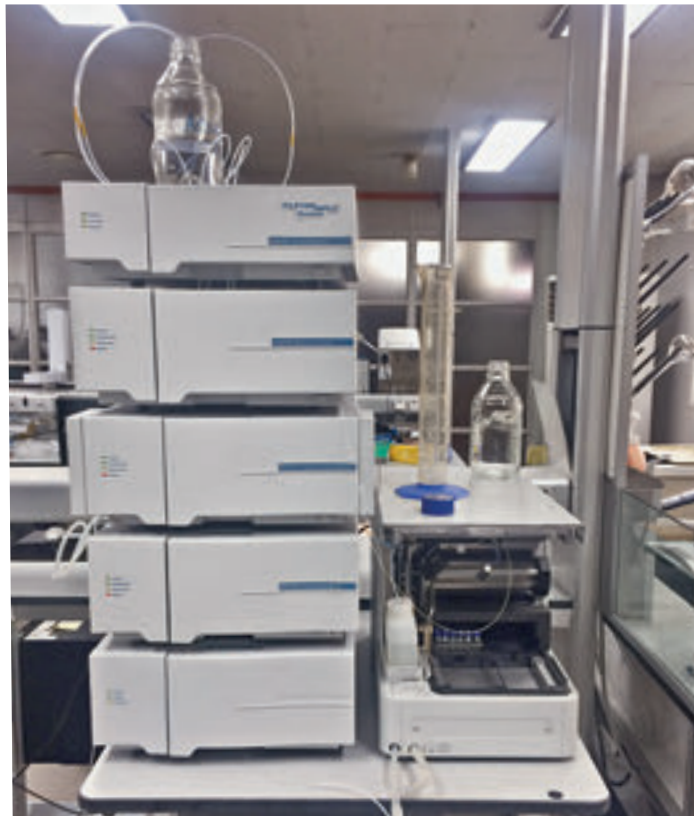
Жидкостной хроматограф YL9100, лаборатория YL Instrumentms, г.Аньян, Южная Корея